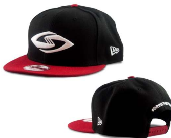
NEW ERA® 9FIFTY®