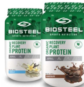
РАСТИТЕЛЬНЫЙ БЕЛОК ДЛЯ ВОССТАНОВЛЕНИЯ