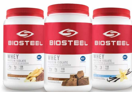
ИЗОЛЯТ БЕЛКА ИЗ СЫВОРОТКИ