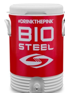
ОХЛАДИТЕЛЬ НА 19 ЛИТРОВ