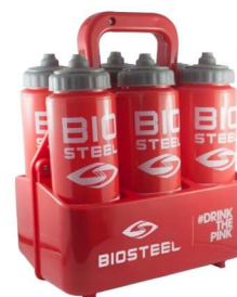
ПЕРЕНОСНАЯ ПОДСТАВКА ДЛЯ БУТЫЛОК BIOSTEEL TEAM