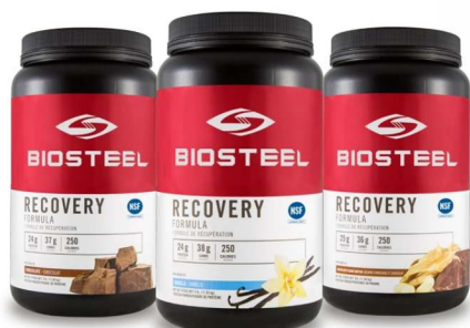
ВОССТАНАВЛИВАЮЩАЯ БЕЛКОВАЯ КОМПОЗИЦИЯ