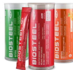
ВЫСОКОЭФФЕКТИВНАЯ СПОРТИВНАЯ КОМПОЗИЦИЯ (ТУБА, 12 ПОРЦИЙ)