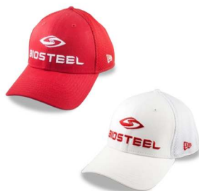
NEW ERA® 39THIRTY®