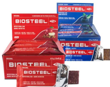
ПИТАТЕЛЬНЫЕ БАТОНЧИКИ «ОРИГИНАЛЬНЫЙ» И «ГОЛУБИЧНЫЙ» (15)