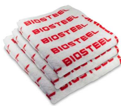
ПОЛОТЕНЦЕ BIOSTEEL PRO GOLF