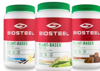
БЕЛКОВАЯ ДОБАВКА НА РАСТИТЕЛЬНОЙ ОСНОВЕ