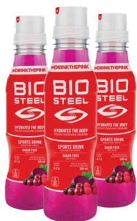
ГОТОВЫЙ НАПИТОК BIOSTEEL (500 мл)