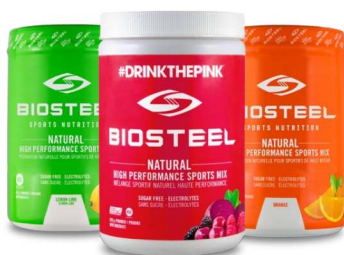
ВЫСОКОЭФФЕКТИВНАЯ СПОРТИВНАЯ КОМПОЗИЦИЯ (315 г, 140 г)